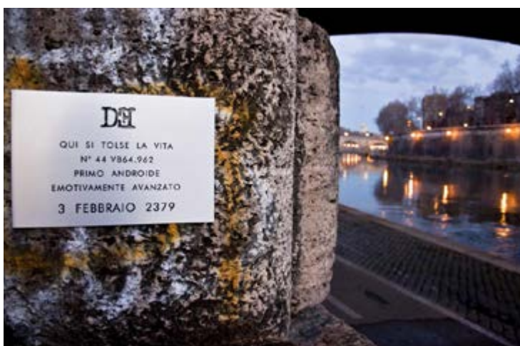
Targa 1 - Roma (zona Isola Tiberina)

Il primo viaggio nel Poi datato febbraio 2379 ci ha condotti nel luogo della sua morte, il Lungotevere romano all'altezza di ponte Garibaldi (Isola Tiberina). Nostro malgrado, quando siamo giunti a destinazione l'androide aveva già praticato il reset finale, dopo aver eliminato ogni suo back up. La seconda occasione in cui il cronotrasporto ci ha avvicinati a N°44 ha come data d'approdo il 9 gennaio 2292, qui abbiamo visitato la fabbrica dove venne assemblato.