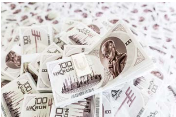
Banconote da 100 Ukron

Dalla conversazione con il Transumanista deduciamo che N°44 abbia goduto di una discreta popolarità per qualche mese, i media gli hanno dedicato molta attenzione, ma per un lasso di tempo limitato prima di riconsegnarlo all'anonimato. Questo non spiega come nell'anno 2504 all'emissione degli Ukron, la prima valuta globale, l'effigie dell'androide svetti sul taglio da 100. Inoltre, sulla stessa banconota compare la stilizzazione di un pomello del cambio menzionato dall'androide come prima stretta di mano tra Uomo e Macchina. Un tributo di questo spessore non può essere rivolto a un personaggio popolare per solo una stagione.