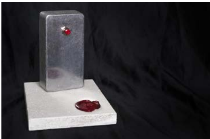
Radiocomando per teletrasporto, anno 2154

Per evitare rischi eccessivi, ci siamo comunque limitati a riportare dai nostri viaggi solo oggetti di piccole dimensioni e dal peso contenuto, tra questi: una penna a induzione (anno 2514), un frammento di muro (anno 2071), un ordigno miniaturizzante innescato ma inoffensivo per altri sette secoli (anno 2769) o un radiocomando difettoso (anno 2154).