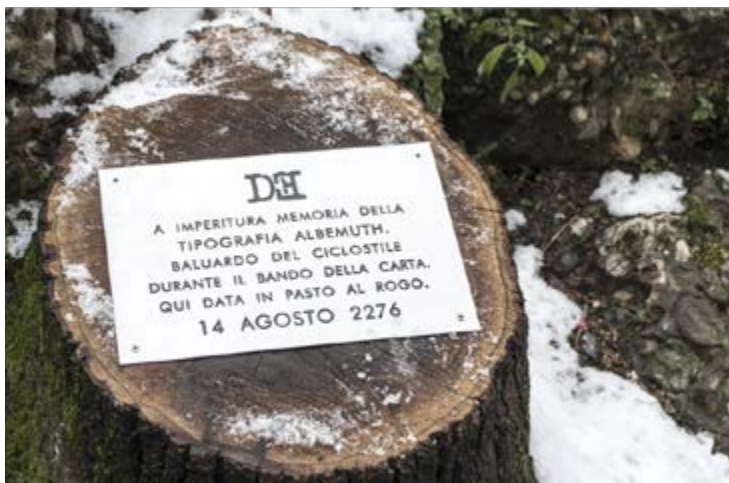
Targa 13 - Milano (Parco Indro Montanelli)

sopracitate in pietra, ma anticipano il Futuro e sono di conseguenza postate. Se ne trovano a Roma, Venezia, Milano, Bologna, Padova e altre località italiane.