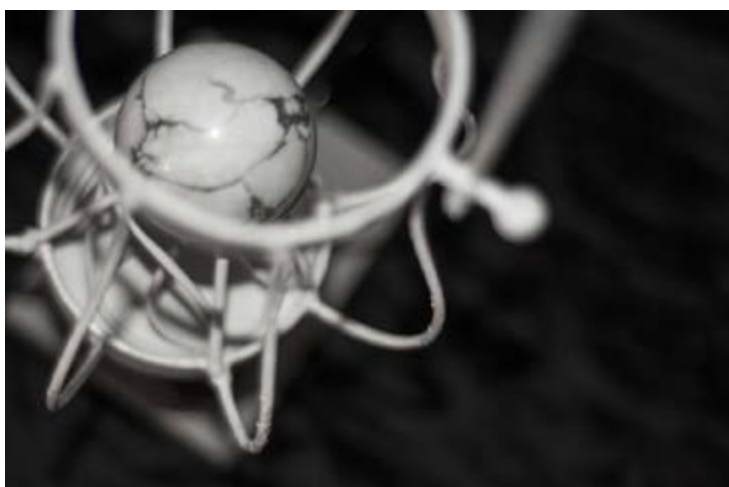
Ordigno miniaturizzante, anno 2769

Come spiegato anticipatamente, importare manufatti dalle dimensioni ridotte non comporta alcun rischio per la struttura spaziotemporale. Ben altra questione si apre se dal Domani viene introdotto nel Presente un manoscritto, perché non si sta più spostando solamente della materia, bensì anche dei concetti. Il Sapere collettivo è composto da una stratificazione d'idee amalgamate nei secoli, sequenziali e legate dal lavoro intellettuale di molti. Il Pensiero procede linearmente, ma possono anche avvenire bruschi salti nel momento in cui un'idea rivoluzionaria viene partorita. Basti pensare all'impatto avuto dall'introduzione di concetti quali il Sistema Copernicano o la Relatività Generale, eppure possiamo sostenere che una scoperta avviene solo nel momento in cui i tempi sono maturi per accoglierla. Vale a dire che non ci sarebbe stato alcun Richard Feynman, se nel 1600 Giordano