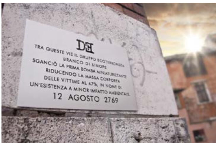
Targa 2, Roma (zona Trastevere)