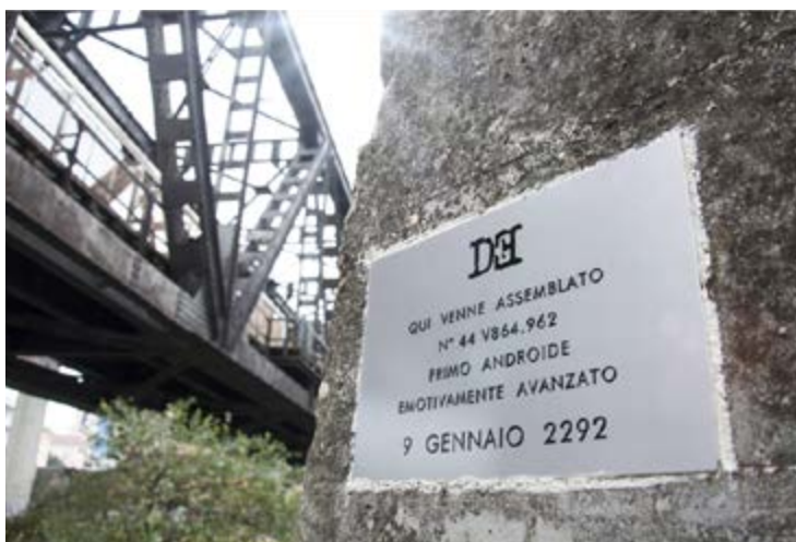
Targa 12 - Pescara (area portuale)